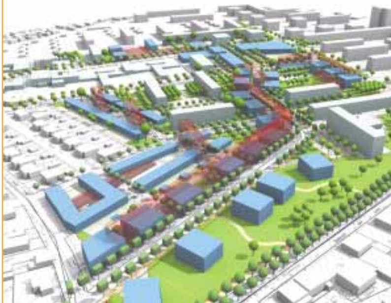
Simulation 3D future