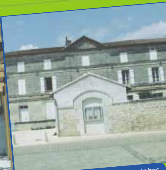
Structures scolaires & périscolaires