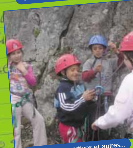
Activités sportives et autres...