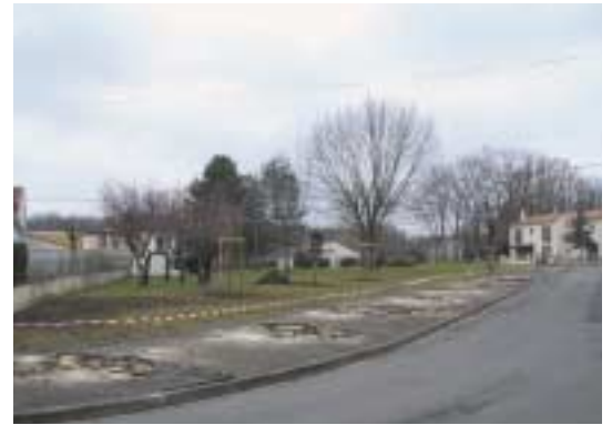
Allée Bois du Maine